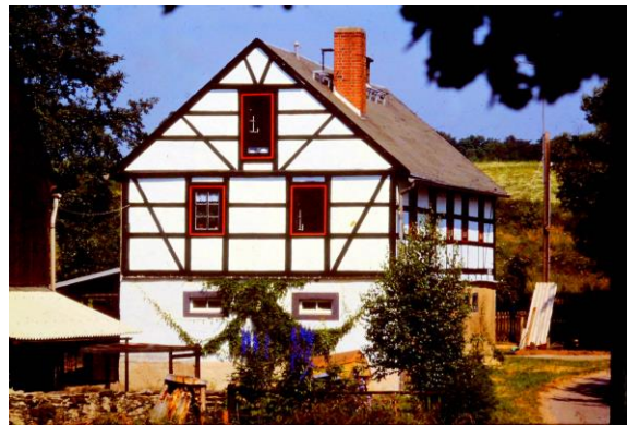
„Reicherts Haus“ im Jahre 2014