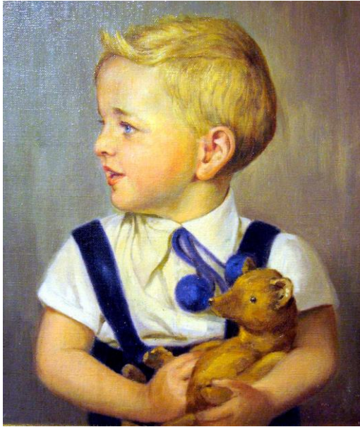
Ulrich Quandt nach einem Gemälde von Carl Kögl

tätig ist, versucht der Kleine, der noch allein im Schlafzimmer der Großeltern im Bett liegt, selbst „Licht zu machen“. Leider brennt dabei das Bett an. Als es die große Schwester Inge bemerkt, ist es bereits zu spät. Mit dem Brettwagen und den Mühlpferden wird der Kleine noch in das Hainichener Krankenhaus gebracht, doch er stirbt an den Folgen der Brandverletzungen und einer Rauchvergiftung.