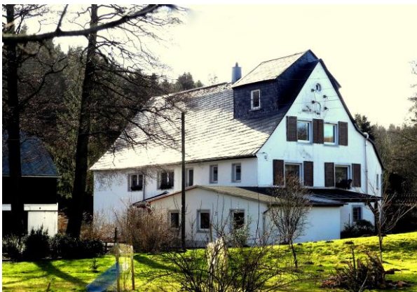
Die Heumühle im Jahre 2015

So wird das Tal der Großen Striegis sicher noch viele Jahre den naturliebenden Wanderer erfreuen. Nicht vergessen wollen wir, wie der Fluß über Jahrhunderte Menschen zum Erwerb ihres bescheidenen Lebensunterhaltes verholfen hat, wie viele Generationen die Geschichte der „Industrie im Striegistal“ mit ihrem Fleiß, aber auch mit großen Entbehrungen und Sorgen, geschrieben haben.