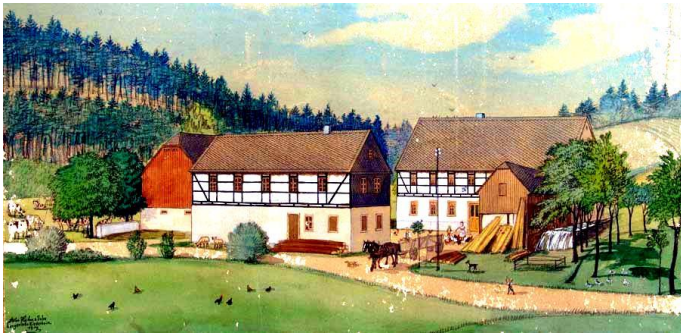
Die Heumühle im Jahr 1920

Ausflugsort Gasthaus. Sommerfrische i. gr. Striegistal.