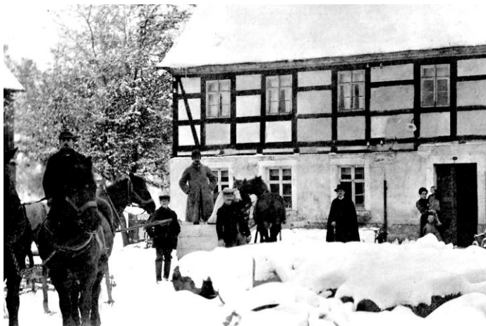
Die Heumühle in alter Zeit im Winter