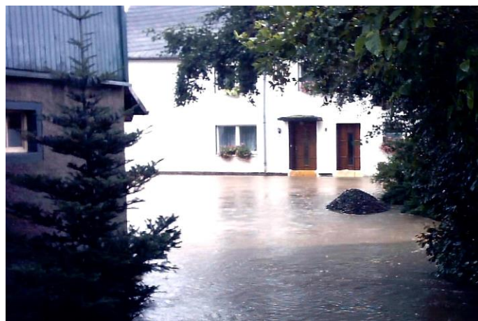
Der Hof der Heumühle im August 2002: Nur noch mit dem Boot ist das Haus zu erreichen

Die Lage der Heumühle im romantischen Tal der Großen Striegis ist sowohl Lust als auch Last. Das wird beim Jahrhunderthochwasser im August 2002 zur traurigen Wahrheit. Meterhoch wälzen sich die schlammigen Wassermassen durch die Wohnung von Gertrud Luft.