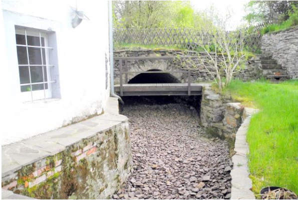
Der Mühlgraben heute – einst drehte sich hier das Mühlrad