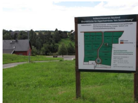
Baugrundstücke „Am Sonnenhang“