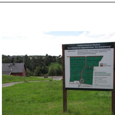
Baugrundstücke „Am Sonnenhang“