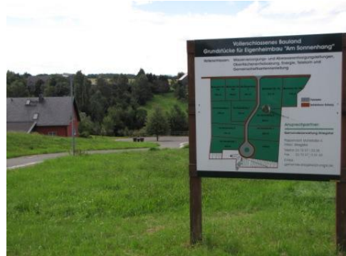
Baugrundstücke „Am Sonnenhang“