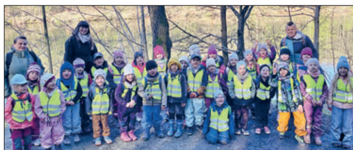
Wanderung vorbei am Krebssteich

Zur Mittagszeit wurden wir in der Diakonie in Gersdorf herzlich versorgt.