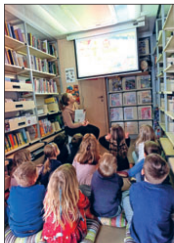
Alle schauen gespannt und lauschen der Geschichte.

Seit vielen Jahren kommt mehrmals im Jahr der Bücherbus zu uns in den Kindergarten. Gemeinsam mit den Erziehern gingen die Kinder immer in kleinen Gruppen und durften durch zahlreiche Bücher stöbern und sich natürlich auch einige für die Kita aussuchen.