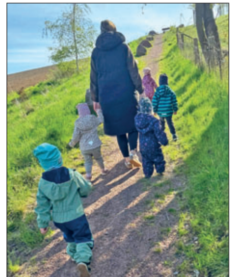
Die Häschengruppe beim Wandern.

Das Team der Kita „Waldblick“ in Böhrigen