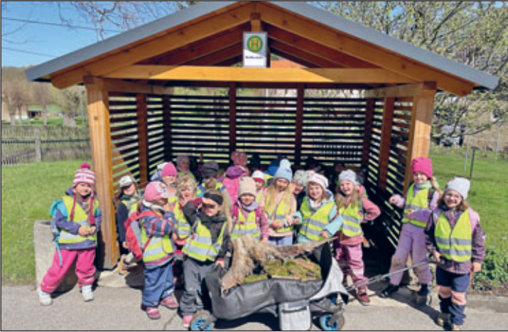
Angeworren bei der Diakonie in Gersdorf

Anschließend ging es weiter auf unserem Weg zurück Richtung Etzdorf zur Kita. Unterwegs wartete noch eine kleine Überraschung auf die Kinder: eine erfrischende Pause mit leckerem Eis – ein gelungener Abschluss für diesen wunderschönen Tag.