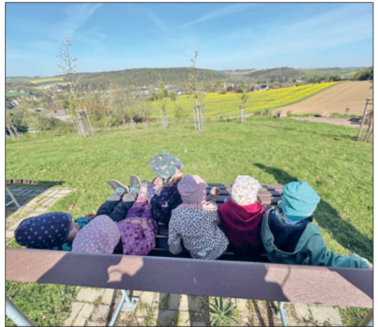
Hier erfolgte die Rast am Aussichtspunkt Böhrigenblick.

Zur gleichen Zeit machte sich die Häschengruppe auf den Weg zu einer kleinen Wanderung. Ziel war der wunderschöne Aussichtspunkt „Böhrigenblick“. Dort angekommen, konnten die Kinder den herrlichen Blick über Böhrigen genießen, die umliegenden Felder und Wiesen betrachten und die Ruhe der Natur auf sich wirken lassen.