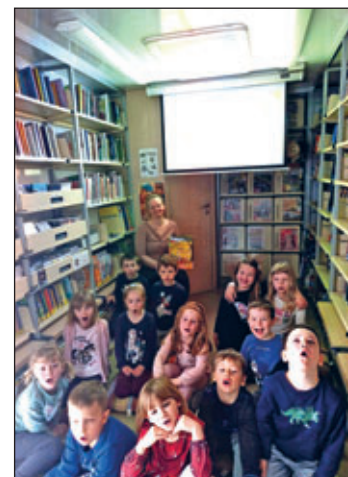
Schmetterlingsgruppe im Bücherbus