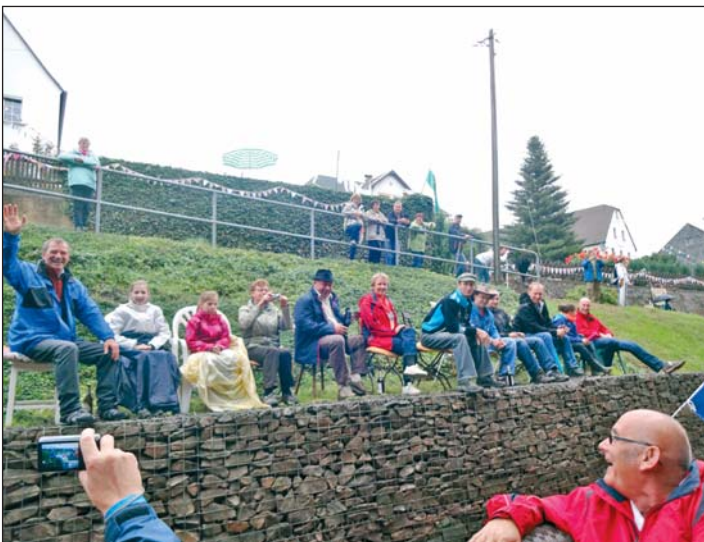
Viele Anwohner und auch Schaulustige aus anderen Ortschaften jubelten dem Festumzug während seiner Ortsdurchfahrt durch Etzdorf zu.