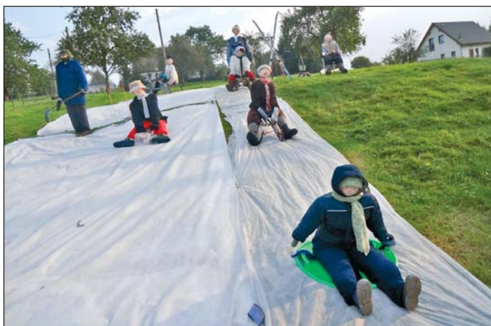
Dieser nachgestellte Rodelhang erinnerte an die Zeiten, wo noch regelmäßig viele Kinder im Winter auf der Wiese am Etzdorfer Steinbach dieser Freizeitbeschäftigung oft stundenlang nachgingen. Dies war mit über acht Puppen eines der umfangreichsten und attraktivsten Motive zur Jahrfeier.