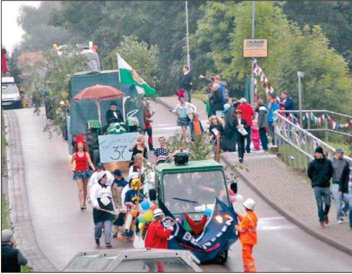
Diese Aufnahme zeigt einen Teil des Umzuges durch Etzdorf.

in einem der ersten Bilder die Gründung von Etzdorf als „Ezwinstorf“ ausgehend vom Grundbesitz Altzella her dar.