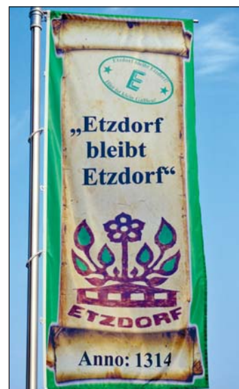
Auch die Handwerker im Ort stellten ihre Motive zur Schau. Hier links im Bild die Schmückung der ortsansässigen Bäckerei Thümer. Die Etzdorfer hatten extra zur Jahrfeier eine Fahne für ihren Ort anfertigen lassen und diese in der Festwoche vorm Gemeindeamt gehisst.