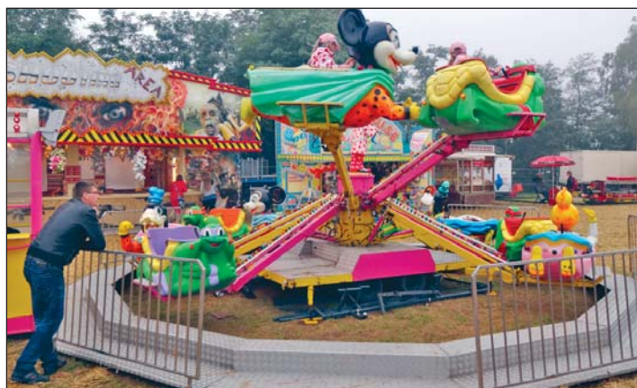
Diese Aufnahme zeigt einen Teil des Festplatzes auf dem Etzdorfer Sportplatzes.