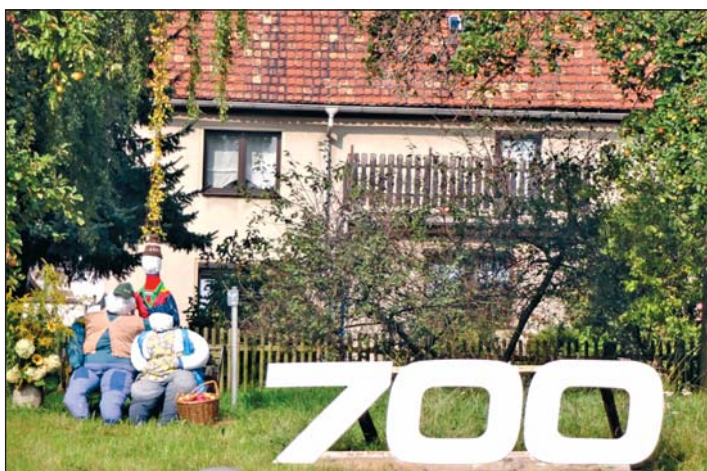
Viele Grundstücke in Etzdorf waren anlässlich der Jahrfeier ideenreich geschmückt. Unsere Aufnahme zeigt das Grundstück von Familie Gerhard Barth auf der Nossener Straße.

dem Festwochenende Besucher anzogen. Ein Höhepunkt war natürlich der Festumzug am 14. September dieses Jahres, bei dem rund 50 Bilder die Geschichte von Etzdorf vermittelten. Mit den nachfolgenden Aufnahmen möchten wir einen kleinen Eindruck von den vielfältigen Aktivitäten dieses Festwochenendes geben. Weitere Fotos finden Sie im Internet unter www.striegistal.de im Link „Aktuelles“.