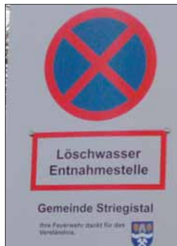
In diesem Jahr wurden alle Löschwasserentnahmestellen im Gemeindegebiet neu beschildert.

Eine Aufgabe der Gemeinde ist der Brandschutz, wobei dieser nur eine der vielfältigen Aufgaben einer modernen Feuerwehr darstellt. Voraussetzung für die Brandbekämpfung ist die Verfügbarkeit von ausreichend Löschwasser. Da im ländlichen Raum unserer Ortschaften die Trinkwasserversorgungsleitungen auf Grund zu geringer Abnahme nicht in Dimensionierungen aufgebaut werden konnten, die eine direkte Entnahme von Löschwasser aus dem zentralen Netz ermöglicht, muss auch in den folgenden Jahr-