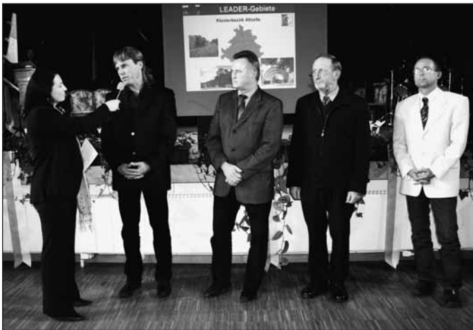
Die Delegation des Klosterbezirkes wird bei der Ernennungsveranstaltung in Lommatzsch von der Moderatorin der Veranstaltung zu den Zielen der Region befragt.