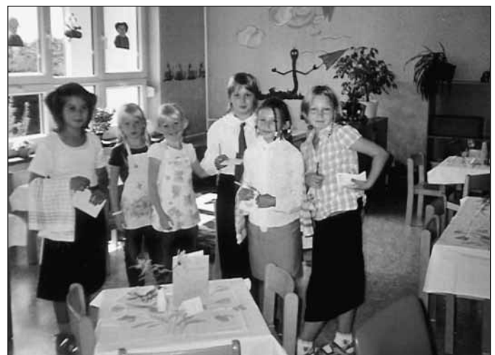
Das freundliche „Hortkinderservicepersonal“ stellt sich in der geschmückten „Gaststube“ vor. (zum Text S. 3/4 in der Amtsblatt-Ausgabe 167 über die Aktivitäten in den Sommerferien im Hort)