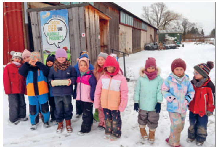
Die Vorschulspatzen besorgen sich ihre Zutaten für den Eiersalat ganz frisch vom Hofladen.