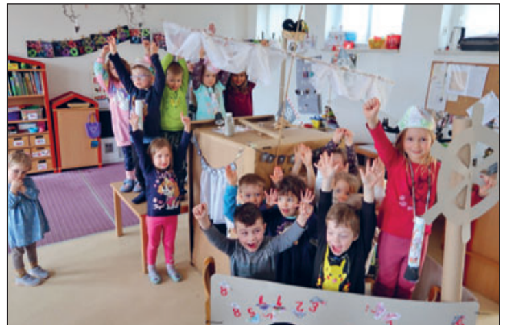
Wir feierten ein lustiges Piratenfest

Passend zu unserem Projekt „Mathepiraten im Zahlenrausch“ bauten wir uns in der ersten Ferienwoche ein großes Piratenschiff und luden alle Kindergartenkinder zu einem Piratenfest ein. Es gab eine große Party mit Musik, Tanz, Schatzsuche und so weiter.