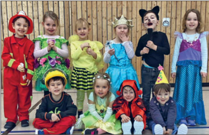
Die Kinder der Abenteuer- und Vorschulspatzen präsentieren ihre tollen Kostüme.

schingsfest in der Turnhalle gefeiert. Es gab leckeren Orangensaft und köstliche Pfannkuchen zur Stärkung. Bei der Kostümvorstellung und dem Luftballontanz hatten alle viel Spaß. Die Polonaise durfte auch nicht fehlen! Zum Abschluss wurde die Turnhalle zur Disco – mit toller Musik und guter Stimmung.