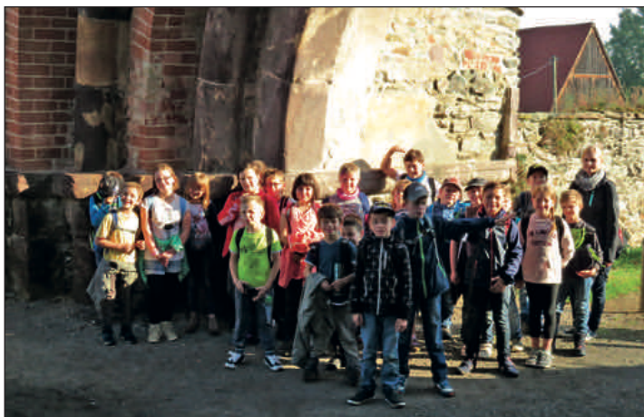
Die Klasse 3 am „Flüsterbogen“ und im Kräutergarten des Klosters.

erwartete uns ein ebenso abwechslungsreiches Programm. Während die Erst- und Zweitklässler als Schatzsucher auf Rätsel-spaziergängen unterwegs waren, erkundete die dritte Klasse auf einer naturkundlichen und schmackhaften Führung vor allem den Kräutergarten und die vierte Klasse tauchte in das frühere Leben der Zisterzienser ein und versuchte sich mit der Station Scriptorium eine Vorstellung von der Schreibkunst der mittelalterlichen Zisterzienser zu machen.