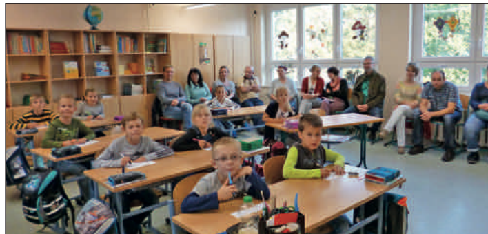
Die Klasse 2 beim „Tag der offenen Tür“

Nach beinahe acht Wochen Unterricht wollten wir mit einem „Tag der offenen Tür“ den Eltern unserer SchülerInnen Einblick in den täglichen Unterricht, das gemeinsame Miteinander und die weiteren Vorhaben im Schulhaus geben. Das Angebot wurde rege angenommen, die Schulzimmer füllten sich an diesem Donnerstag mit interessierten Gästen und der Schulförderverein lud zu einem köstlichen Kuchenbasar mit Kaffee ein. Dadurch ergaben sich rund um das Erlebte viele offene Gespräche, die flüchtige Kontakte stabilisieren und das Verständnis füreinander stärken. Die Kinder gaben sich ganz besondere Mühe, um ihren Gästen Unterricht und Schule begeistert zu präsentieren. Allen Beteiligten gilt ein herzliches Dankeschön!