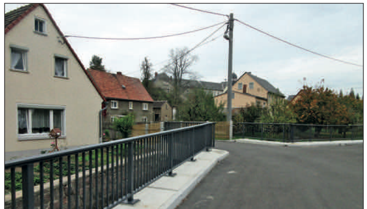
Ende Oktober dieses Jahres sind die neuen Geländer auf den Brücken fertig aufgebaut, mit denen sich die Straße Am Steinbach in einem verbesserten Ortsbild zeigt.