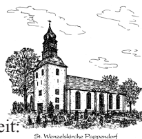
St. Wenzelskirche Pappendorf

Die Zeit vergeht; sie kehrt nicht zurück. Die Gelegenheiten kommen nicht wieder. Gott wollt mich zum Zeugen Seiner Herrlichkeit: Ich sollte den Menschen ein Licht sein, dass sie ihn rühmten. Er wollt meine Stille, meine ruhige Gelassenheit. Freundlich sollte ich gegen meine Mitmenschen sein, sollte vergeben und vergessen,