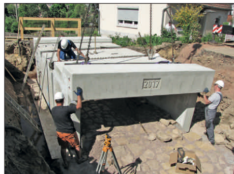
Hier wird das mit Jahreszahl versehene letzte Brückenelement über dem bereits vorgefertigten neuen Bachbett eingebaut, so dass im Anschluss die weiteren Betonbau-, Abdichtungs- und Verfüllarbeiten beginnen können.