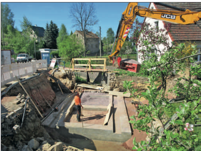
Anfang Mai dieses Jahres ist die alte Brücke bereits beseitigt und die Arbeiten an den neuen Fundamenten haben begonnen.

Nachdem bereits bis Dezember 2016 der Ersatzneubau einer neuen Brücke für die Anwohner der Straße Am Steinbach 8 bis 40 zum Abschluss gebracht werden konnte, wurde in diesem Jahr das zweite marode Bauwerk in diesem Bereich komplett abgerissen und neu aufgebaut.